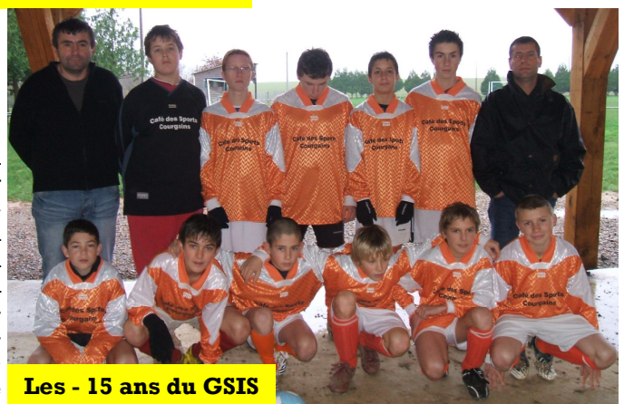
Les - 15 ans du GSIS

L'équipe « B », en 4ème division, se fait plaisir, tous les dimanches, dans la bonne ambiance et attend déjà la deuxième phase du championnat.