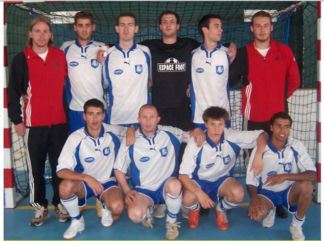
La sélection au tournoi anniversaire du RCM

Un championnat (de septembre à mai) est créé depuis trois ans avec