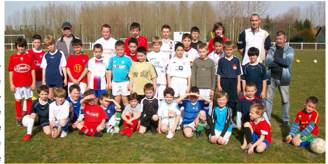
L'avenir du club se trouve parmi ces joueurs

Cette difficulté actuelle n'est qu'une étape, la descente va certainement donner l'occasion à l'US Lucéenne de rebondir. C'est avant tout un club formateur, ce ne sont pas les 75 licenciés jeunes, assidus à l'école de foot, qui diront le contraire. Les plus grands sont engagés dans le groupement de jeunes « Sud-est Manceau Lucé ».