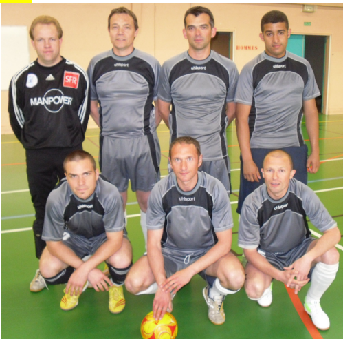
L'équipe au challenge inter-districts

La section compte 25 joueurs répartis dans deux équipes évoluant toutes deux dans l'élite départementale. L'équipe 1 s'y comporte parfaitement pour preuve son palmarès qui est le suivant : 2009/2010 = champion, 2008/2009 = vice-champion