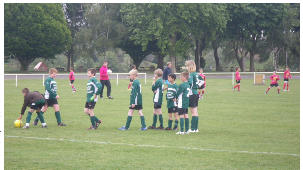
En 2010, la journée finale U11 a eu lieu à La Ferté Bernard

C'est le secteur des PAS : Pas de feuilles de matches, Pas de classement, Pas de cotisations, Pas de frais de fonctionnement. Chaque club prend en charge les récompenses (4€/joueur) qui sont remises lors du tournoi de fin de saison. Cette année le 29 mai à La Ferté pour le U11 et le 5 juin à Montfort pour les U7/U9.