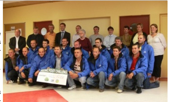
La remise du coup d'éclat à l'US Flée

Certaines formations, comme le « certificat d'accompagnateur d'équipes », sont denses et occupent de nombreuses personnes en utilisant leurs compétences spécifiques. Pour