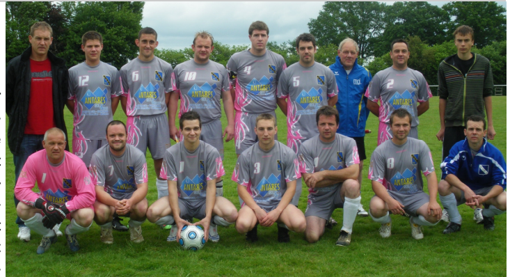
L'équipe lors du titre des champions 2009/2010

Pour cette nouvelle année, la première en seconde division, quelques joueurs sont venus compléter un groupe dont la majorité de l'effectif est déjà en place.