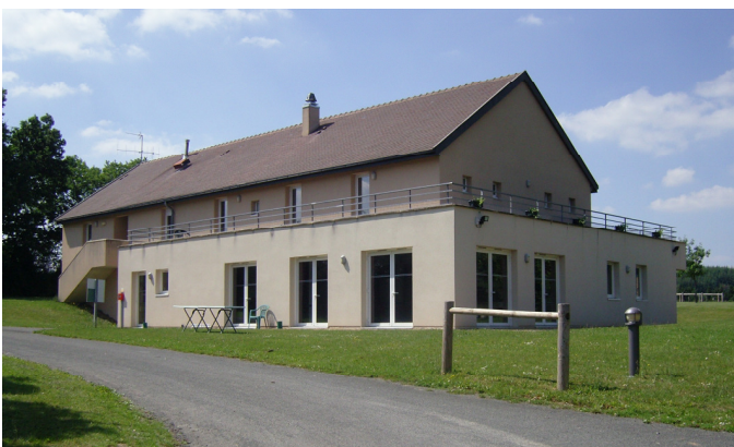
Le bloc hébergement - salles de réunions

Après la disparition du site du « château de Rive-Sarthe », le district était orphelin de centre d'accueil. Un accord était passé avec Le Lude pour l'utilisation du centre de « Vaunaval ». Celui-ci, que nous visiterons le mois prochain, est bien loin du nord de la Sarthe, ce qui provoque des difficultés pour les clubs « Nordistes ».