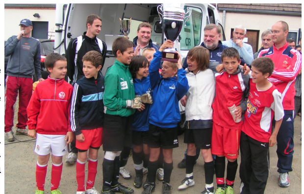
Les vainqueurs du « Lacroix/Coutant » 2010

Alain collecte les résultats et assure le suivi des classements et des licences.