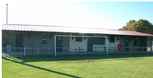
Les vestiaires seront bientôt terminés

Le développement le plus notable se situe au niveau des installations. Le stade a bien changé ces derniers temps et ce n'est pas terminé. Les vestiaires ont été étendus. Ils sont en cours d'achèvement avec pour particularité d'avoir été réalisés grâce au savoir faire des bénévoles. En effet, des subventions ont été obtenues, mais c'est avec la sueur des nombreuses bonnes volontés venues apporter leur concours que le ciment a été fabriqué.