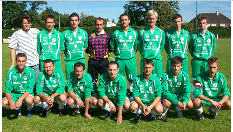
L'équipe avant la rencontre contre l'ES Connerré