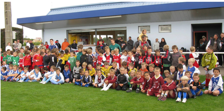
Il y a toujours de la jeunesse sur les terrains de l'ESV

En 1991/1992 les dirigeants de Malicorne, Noyen, Mezeray, Chantenay et Villaines décidaient de se regrouper pour créer « l'Entente Cantonale de Football ».