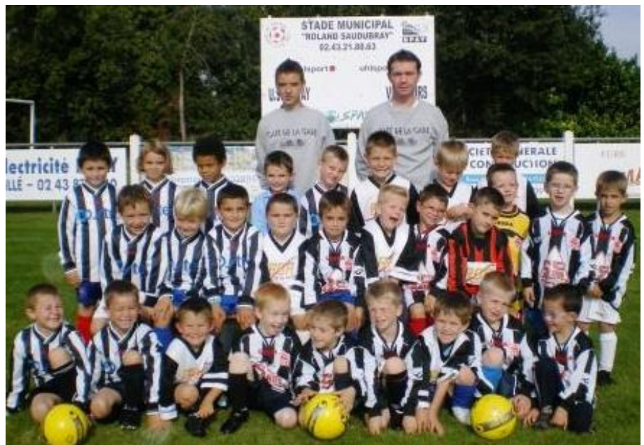
Une école de football « labellisée » et pleine de promesses