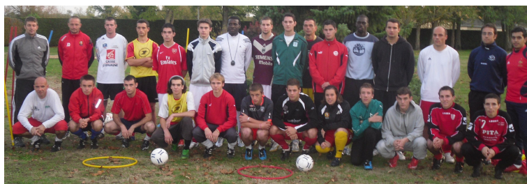
Les stagiaires de II du Lude et leur encadrement