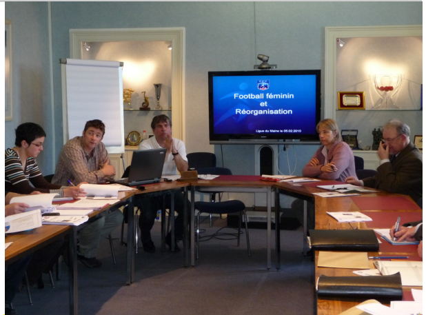
Une partie des participants à la réunion