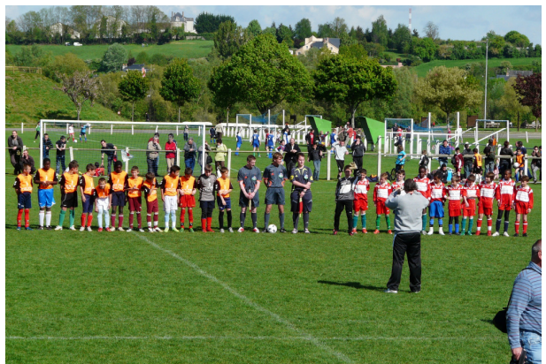
Le secteur vainqueur du challenge G. Lacroix 2009

Un centre d'animation féminin est en place à Parcé sur Sarthe. Une douzaine de jeunes filles sont présentes à chaque rassemblement et ont constitué une équipe en première phase. Pour la fin de la saison, elles retrouveront la mixité dans leur club.