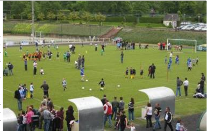
Il y a toujours foule à la journée nationale des débutants plus de 1000 enfants en 2009

Nouveau créneau depuis cette saison, six des huit secteurs font évoluer