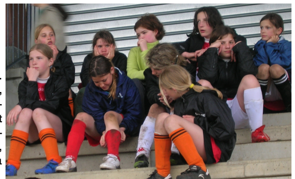
Une partie des « filles » du secteur

Les U11 jouent le samedi après-midi, sous forme de plateaux à quatre équipes en première phase et depuis la reprise huit équipes jouent des rencontres simples, les sept autres évoluant toujours sous forme de plateaux.