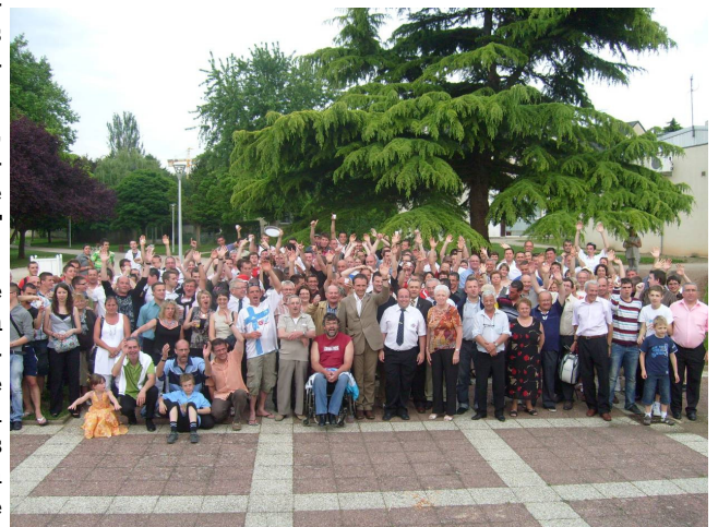
En 2010, le 28ème Challenge était à Coulainnes