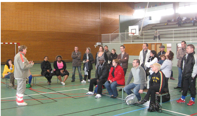
Des parents et dirigeants attentifs aux conseils de la croix rouge