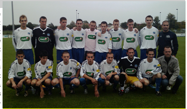
L'équipe avant de jouer l'AS St Pavace

Aujourd'hui, cela se passe plutôt bien en championnat où l'équipe est calée en milieu de tableau avec pour objectifs de jouer le maintien en essayant de viser le haut de tableau, tout en remportant la coupe du district dont elle a déjà été finaliste en 2008.