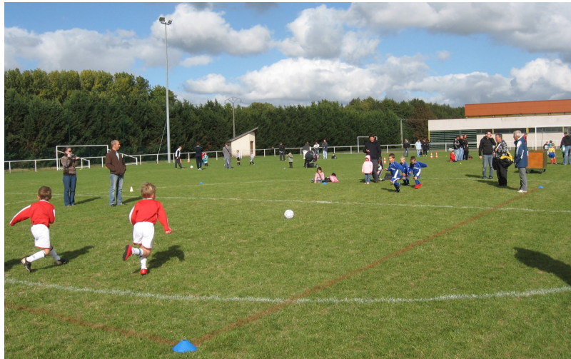
La journée de rentrée des U6/U7 avait lieu cette année à Arnage