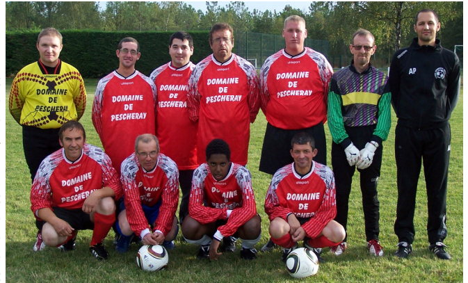
L'équipe de la section sport adapté

L'ambition est bien entendu de voir les deux équipes avancer d'un, voire de deux niveaux, mais c'est difficile dans des groupes où figurent des réserves de clubs plus huppés et cela ne semble par irréaliste, l'équipe première