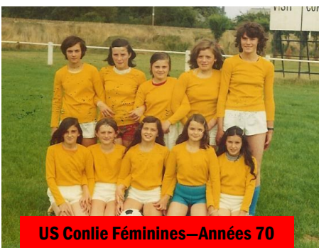
US Conlie Féminines—Années 70

Une équipe de fille avait déjà vu le jour dans les années 70.