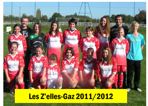
Les Z'elles-Gaz 2011/2012