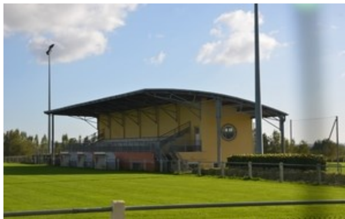
Le stade Valère Huet