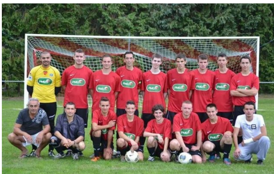
L'équipe de l'AS LAVARÉ entourée de ses dirigeants formant le noyau amical.