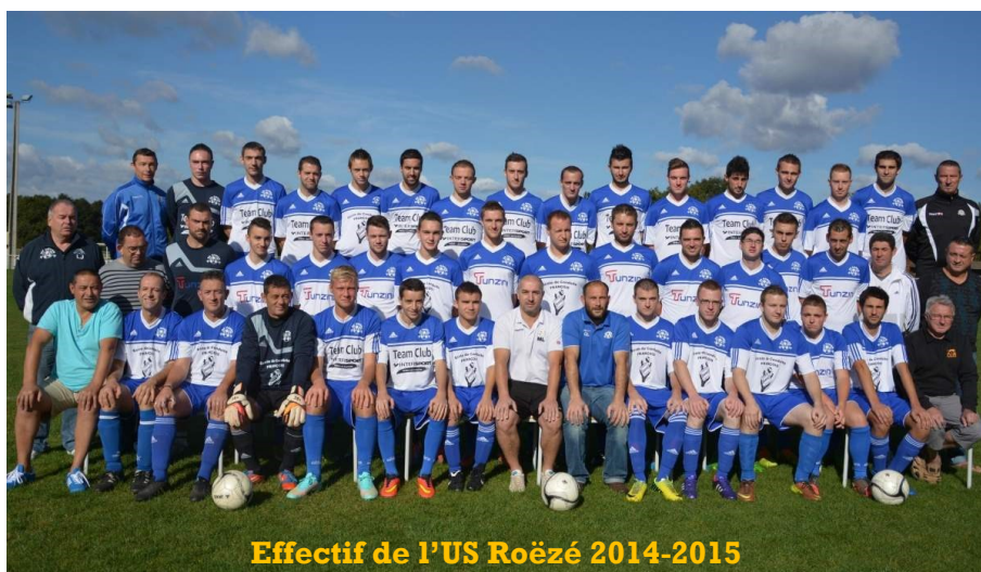
Effectif de l'US Roézé 2014-2015

Je lui souhaite d'évoluer dans le monde du football et de prendre le maximum de plaisir en réalisant sa passion.