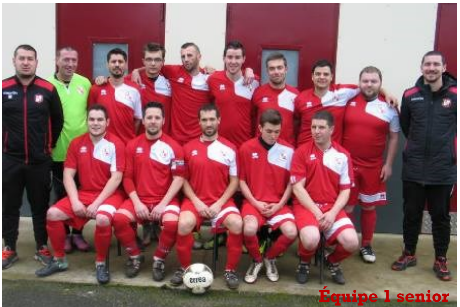
Équipe 1 senior

Je suis à la recherche d'un élément qui devient indispensable : C'est un arbitre !