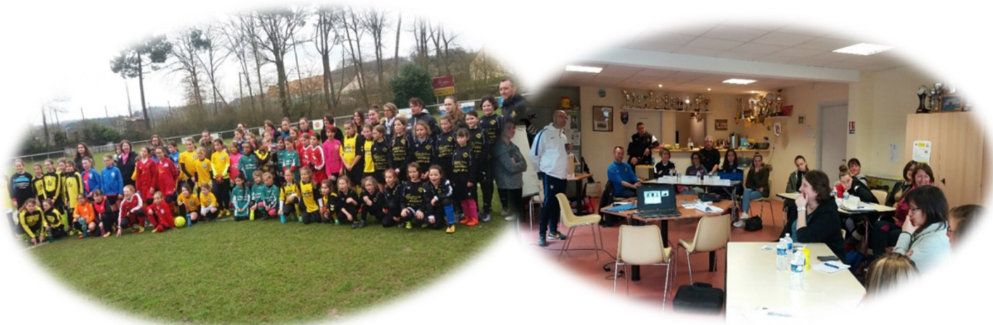
Un module de formation d'Animatrice Fédérale de Football à Écommoy le 24 mars 2018

L'objectif de ce module est de former l'encadrement des équipes féminines. Il est donc ouvert aux femmes (dès 16 ans) impliquées dans l'accompagnement des équipes féminines (primaire, collège et lycée), aux licenciées et non licenciées. Dans le cadre de l'opération « Mesdames, franchissez la barrière », le District prenait en charge les coûts de formation.