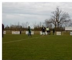
LE LUART US