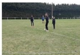
MAYET VIGILANTE LE BREIL/MERIZE US