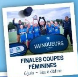
FINALES COUPES FÉMININES 6 juin - lieu à définir