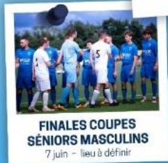
FINALES COUPES SÉNIORS MASCULINS 7 juin - lieu à définir