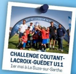
CHALLENGE COUTANT-LACROIX-GUÉDET U11 1er mai à La Suze-sur-Sarthe