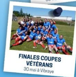
FINALES COUPES VÉTÉRANS 30 mai à Vibraye