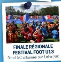
FINALE RÉGIONALE FESTIVAL FOOT U13 3 mai à Challonnes-sur-Loire (49)