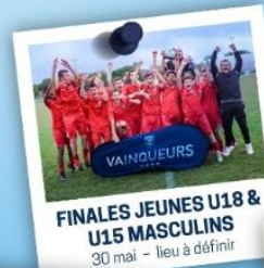
FINALES JEUNES U18 & U15 MASCULINS 30 mai - lieu à définir