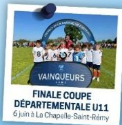
FINALE COUPE DÉPARTEMENTALE U11 6 juin à La Chapelle-Saint-Rémy