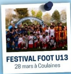
FESTIVAL FOOT U13 28 mars à Coulaines