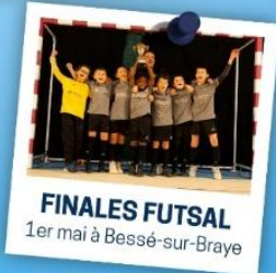
FINALES FUTSAL 1er mai à Bessé-sur-Braye