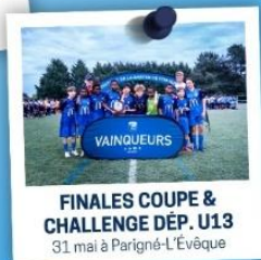
FINALES COUPE & CHALLENGE DÉP. U13 31 mai à Parigné-L'Évêque